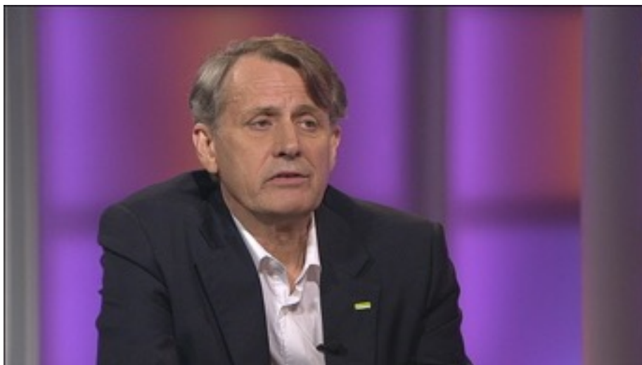
Anders Sundström, ordförande Swedbank

Sedan systemchocken 2008 - när Swedbank höll på att gå omkull efter vidlyftig utlåning i Baltikum - är Folksam, Sparbankerna och facken storägare i banken.