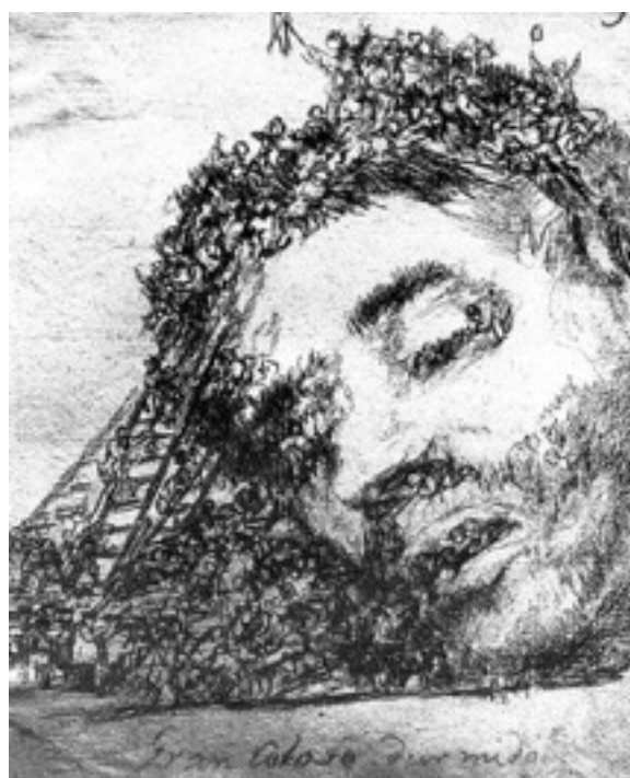
Den sovande jätten - målning av Goya

Nu måste medvetenheten spridas om att bolagssossarna måste köras ut ur arbetarrörelsen, banden klippas till partiet och banken, och en upprustningsoffensiv inledas från fackklubbarna på golvet. LO har 158 000 förtroendevalda och 1,5 miljoner medlemmar. De förfogar över väldigt mycket pengar och kraft tillsammans som nu förslösas, binder ris åt de egna ryggarna och finansierar demonteringen av det som en gång var en arbetarrörelse och en motkraft till bolagsmakten. Denna sovande jätte skulle faktiskt kunna räta på ryggen, skaka av sig lössen i pälsen - bolagssossarna - och sätta sig i verklig rörelse för sina egna intressen.